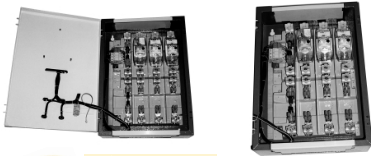
TABLEAU <VH> POUR 1 ABONNÉ TARIF JAUNE AVEC DOUBLE SECTIONNEMENT <TJ2>